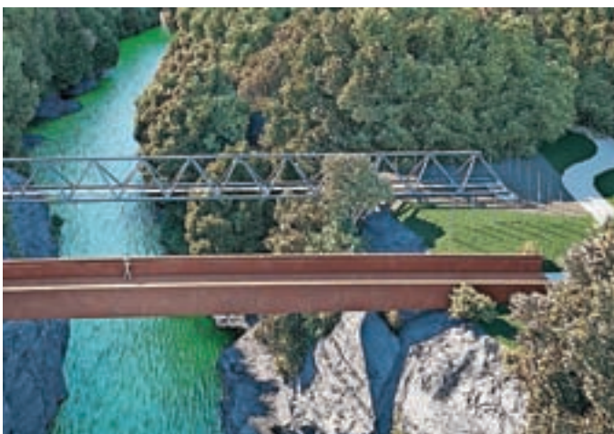
Idejna zasnova mostu čez Kokro

Mestna občina Kranj zaključuje projektiranje povezave za pešce in kolesarje, ki bo povezala športni park in Zlato polje z industrijsko cono IBI ter Primskovim. S tem bodo občani Kranja dobili krajšo trajnostno povezavo tako s športnim parkom kot z industrijsko cono IBI, hkrati pa se bo za javnost odprla dragocena zelena površina ob kanjonu reke Kokre, poudarjajo. Vlogo za izdajo gradbenega dovoljenja bodo vložili predvidoma v začetku leta 2022. V primeru odobrenega sofinanciranja z evropskimi sredstvi bi gradnjo lahko začeli že v drugi polovici leta 2022, projekt pa končali v letu 2023.